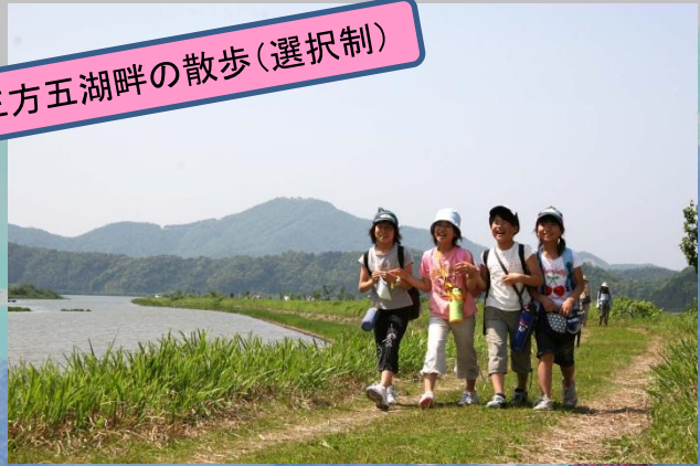
三方五湖畔の散歩(選択制)