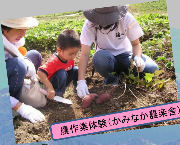
農作業体験(かみなか農楽舎)