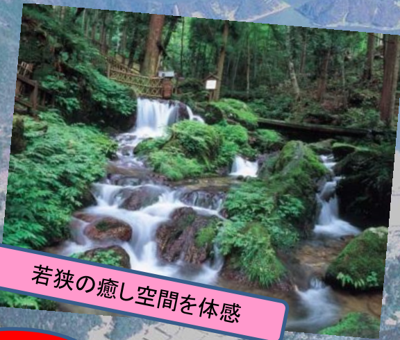
若狭の癒し空間を体感